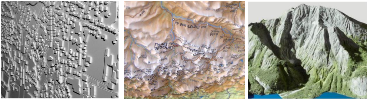
Voorbeelden van reliëfkaarten

Maak plattegronden zo mogelijk in een eenvoudig en grof reliëf zodat een blinde ook de kaart kan aftasten. Wanneer de lijnen van een plattegrond op een paneel zo worden uitgefreesd dat zij voelbaar zijn, wordt een plattegrond ook bruikbaar voor blinden.