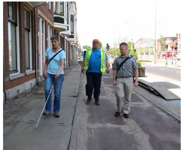
Nu gaat het nog goed...