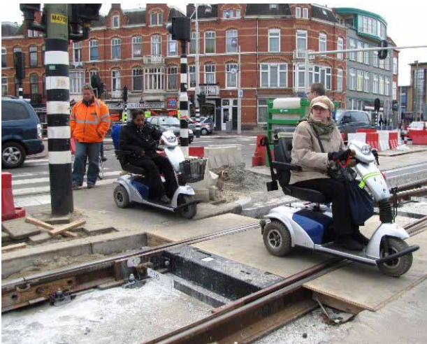
De omleiding wordt getest

Belangrijkste conclusie was dat problemen tijdens een wegopbreking zich (vooral) voordoen bij de begin- en eindpunten van de werkzaamheden. Het verdient aanbeveling de behekking en de bebording ter plekke zeer goed te overwegen, rekening houdend met de diverse categorieën weggebruikers, met of zonder beperking. Alle leerpunten kunnen worden omgezet als aanvullende eisen bij het instemmingsbesluit.