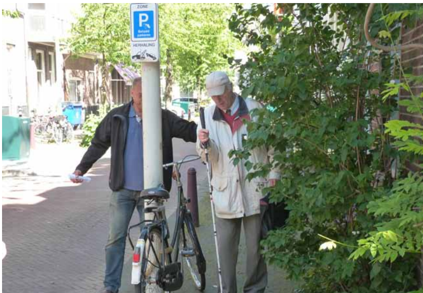
Groen, lantaarnpaal en fiets op de stoep

Voorall vindt de Ervaringstour een goed middel om het bewustzijn over toegankelijkheid in het verkeer te vergroten en zal deze daarom in de toekomst blijven inzetten!