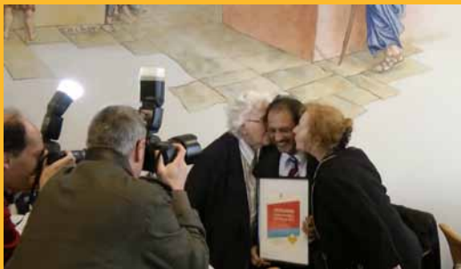
taxibuschauffeur van het jaar