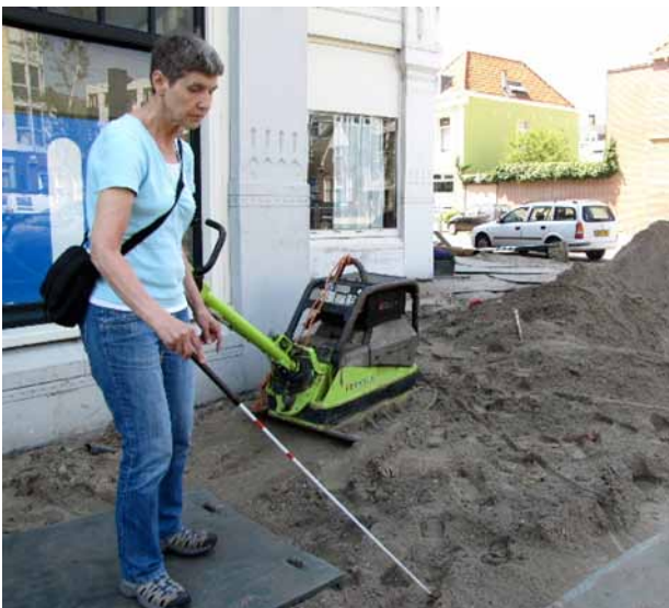
... maar waar moet ik nu heen?