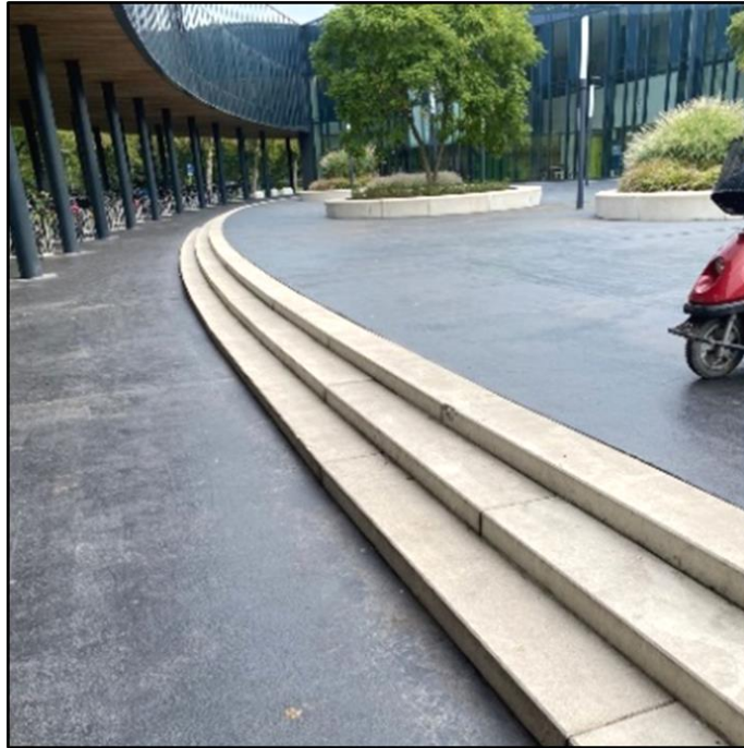
Trap zonder waarschuwingsmarkering en contrast en zonder leuning

Buiten voor het gebouw bevinden zich enkele treden, een soort bordes. Hier is aan de bovenzijde geen waarschuwingsmarkering (noppentegel). Iemand die blind is krijgt dus geen signaal dat hier een trap begint. Er is wel een duidelijk kleurcontrast aan de boven- en onderzijde van de trap. Contrastmarkering op de treden ontbreekt. Ook is er geen leuning aanwezig.