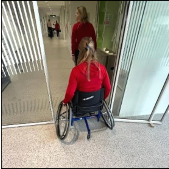
Rolstoelgebruiker bij de openstaande deur naar de opleidingsgang

De deuren naar de klaslokalen en gespreksruimtes zijn niet erg zwaar en gemakkelijk open te maken. De deur naar de opleidingsgang staat altijd open. Er zijn geen elektrische deuropeners. Alleen richting de nooduitgang is een dubbele deur die zwaarder opengaat.