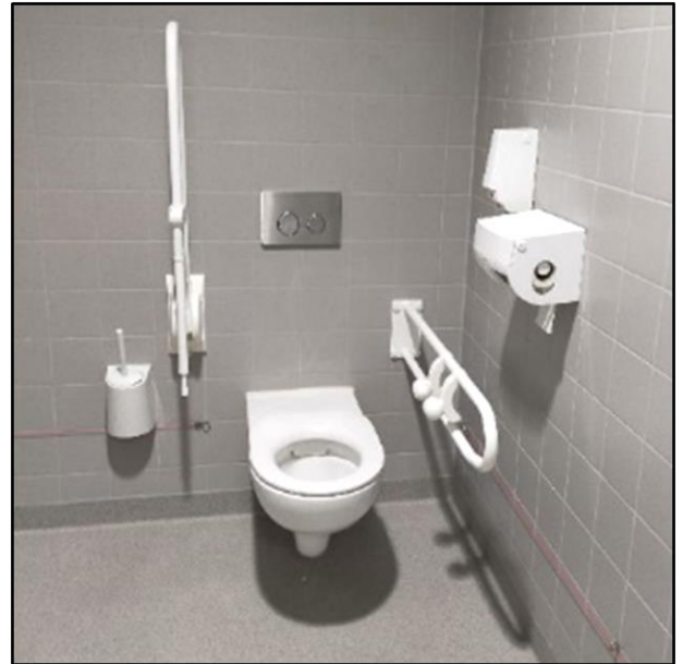
Toiletpot met een vaste en losse beugel en met daaraan een toiletrolhouder