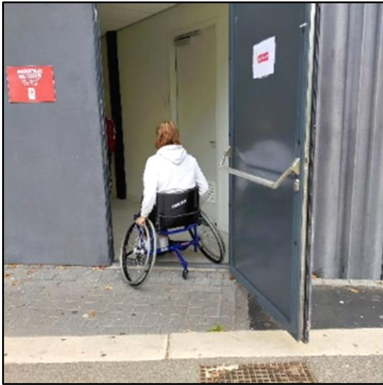
Rolstoelgebruiker bij de gelijkvloerse nooduitgang

De drempel bij de nooduitgang was slechts 1,5 cm, aan de buitenzijde kon je zo het terrein oprijden. Prima! Opvallend was wel dat de sportrolstoelen zo breed waren (90cm) dat deze maar nauwelijks door de deur pasten. Maar we gaan ervanuit dat een gastspreker die met zijn eigen sportrolstoel komt, hiermee zo behendig is, dat hij hem door de deur weet te manoeuvreren. Dat lukte de leerlingen ook.