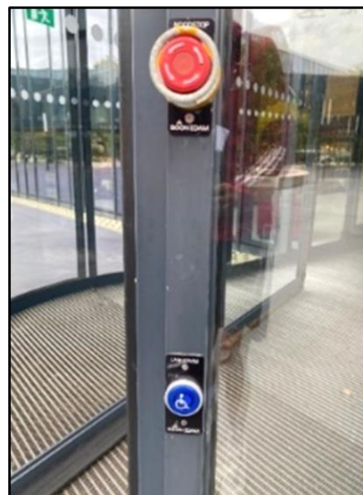
Noodknop en rolstoelknop bij tourniquet