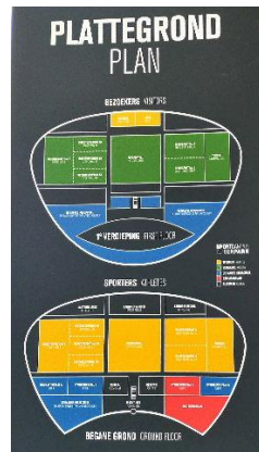
Plattegrond van het gebouw

Naast de tourniquet, een eindje naar achteren, stond een groot bord met een plattegrond van het gebouw. Een deel hiervan was goed te lezen, maar een deel ook niet, door een te gering kleurcontrast (oranje op wit).