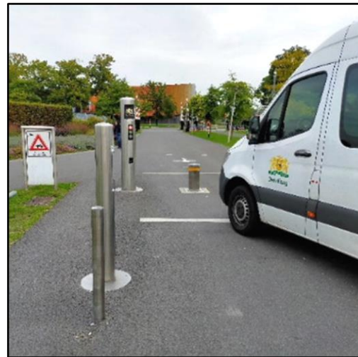
De bus van AV 070 staat voor de poller