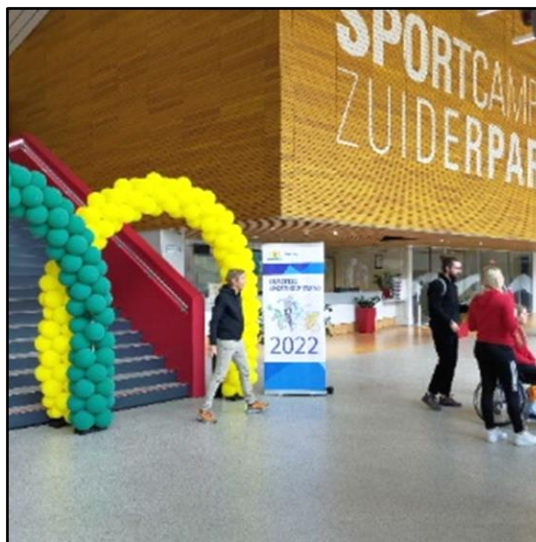
Ruimte na binnenkomst, zonder bewegwijzering

De bewegwijzering was minimaal. Bordjes bij de entree tegenover de ingang werden gemist. Als bezoeker heb je geen idee of je links, rechts of rechtdoor moet.