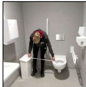
Ruimte naast de toiletpot wordt gemeten