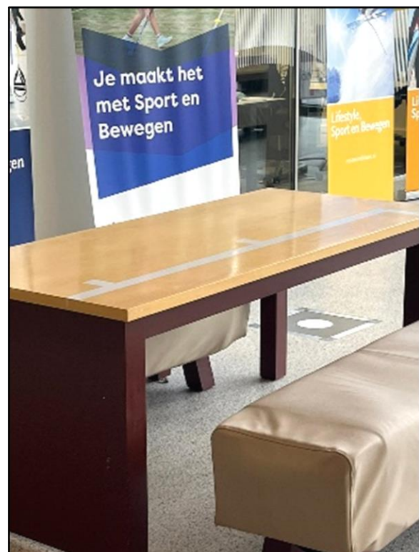
Tafels in de hal zijn niet onderrijdbaar en hebben een dichte zijkant