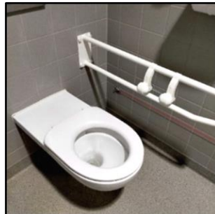
Vaste beugel naast toiletpot