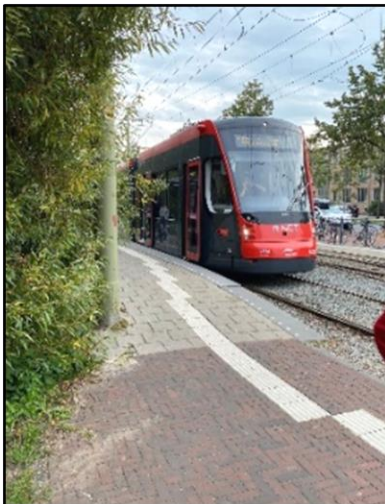
Halte Zuiderpark met tram

Een uitstapplaats voor taxibus of regiotaaxi of voor een passagier bevindt zich voor de deur, binnen 50 m afstand. Maar: dan moet je wel door de pollers kunnen om het Zuiderpark in te komen. Voorheen was er een spreekluisterverbinding met de receptie, nu heb je een pasje nodig. Navraag bij de centrale van AV070 leert dat niet iedere bestuurder van de AV070 een pasje heeft om de poller omlaag te doen. Nu kwam de chauffeur van de taxibus niet verder dan de pollers. Iemand die blind is moet dan op eigen kracht de Sportcampus zien te vinden. De pollers kunnen vanuit de receptie van de Sportcampus wel bediend worden. Dit wordt echter niet gecommuniceerd bij de pollers.