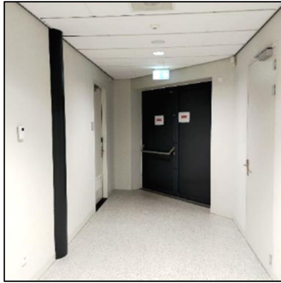
Nooduitgang van binnenuit gezien