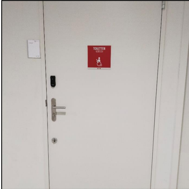
Duidelijk bordje met pictogram van een rolstoel op de toiletdeur