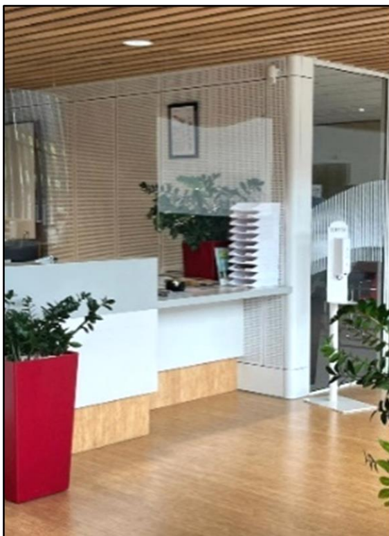
Balie met verlaagd deel

Bij de aanschaf van nieuw meubilair zorgen voor onderrijdbare tafels in de hal.