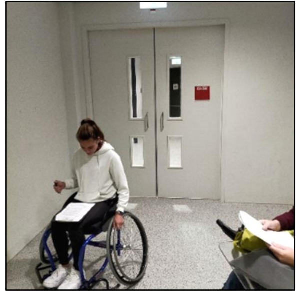
Dubbele deuren richting de nooduitgang