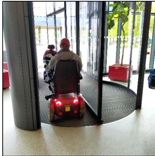
Rechtgaande doorgang door de tourniquet