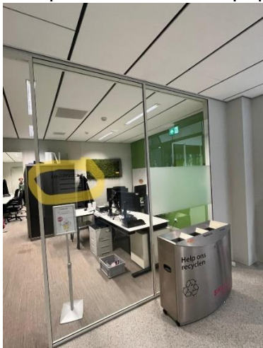
'Administratie' binnen de gele markering op de foto

Hang aan de achterzijde van deze letters iets met een witte achtergrond, bijvoorbeeld een poster of een wit papier, zodat de letters zichtbaar worden.