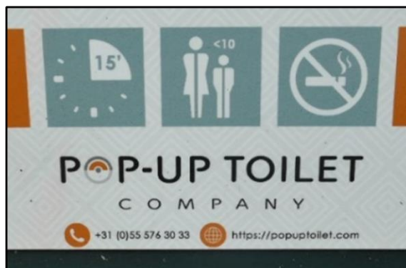
Naam van de beheerder en diens Telefoonnummer