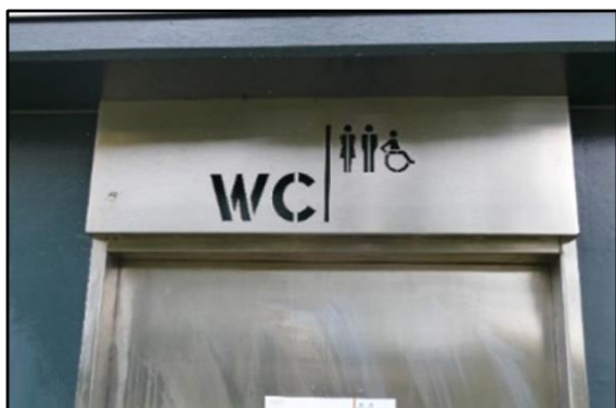
Duidelijk aangegeven aan de parkzijde