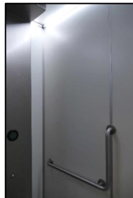
Lege wand zonder haakje