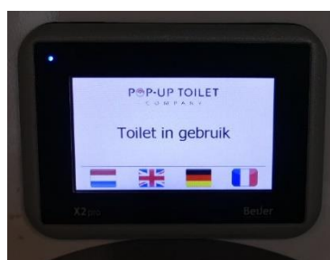
"Toilet in gebruik"