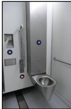
Toiletrol rechtsboven de wc-pot

12. Is er een beugel op de binnenkant van de deur op 90 cm? Niet van toepassing.