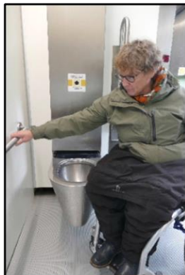
Beugel aan de muur