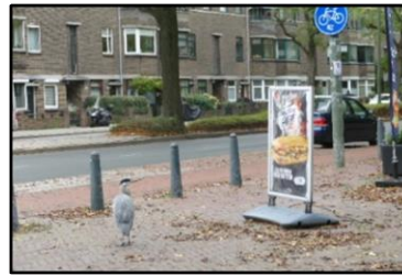
Hoek Vreeswijkstraat – Renswoudelaan – Anna Polakweg