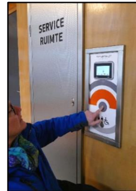
"TOILET" op de deur Entreehalletje Bedieningspaneel Druk op de knop