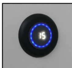
Klokje telt af van 15 tot 0 minuten

Het systeem om binnen te komen is exact hetzelfde als bij het eerder beschreven toilet. Bij het toilet: een druk op de knop, en de schuifdeur opent zich. Ook weer gratis toegang. Na het bezoek van de vorige gebruiker is alles automatisch gespoeld en gereinigd. De wastafel is ingebouwd. Water en zeep stromen toe als de hand op de goede plek wordt gehouden. Evenzo vindt het drogen plaats. Closetpapier komt van de rol na een druk op de juiste knop. De gebruiksduur van het toilet is maximaal 15 minuten. Een klokje (er op drukken om ruimte te openen) telt de minuten duidelijk af. Voor een volgende bezoeker is het toilet in die tijd gesloten.