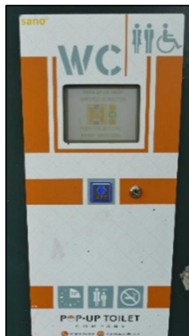
Beeldscherm nauwelijks leesbaar