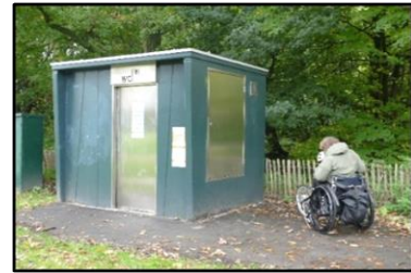
Anna Polakweg, nadering van het toilet vanaf bovengenoemd kruispunt