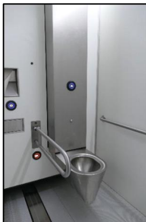
Beugel rechts neergeklapt