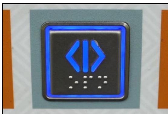
De open-knop. De tekst in braille:- zónder de E - OPN