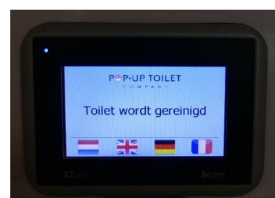
"Toilet wordt gereinigd"

De aanduiding TOILET op de schuifdeur is duidelijk. De grote letters zijn goed zichtbaar vanuit de ruimte waar de fietsers binnenkomen om hun rijwiel te stallen. Voor zeer slechtzienden is dat een ander verhaal. Zij moeten al weten dat hier zich het toilet bevindt. Belangrijk is dat de aanwezigheid van het openbare toilet breed gecommuniceerd wordt.