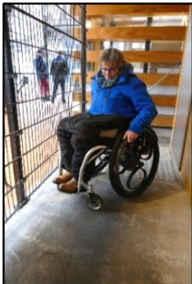
Lastige helling voor rolstoelgebruikers