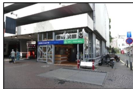
Entree van de fietsenstalling annex toiletvoorziening onder het toezienend oog van de Haagse toren

Het systeem om binnen te komen is exact hetzelfde als bij het eerder beschreven toilet. Bij het toilet: een druk op de knop, en de schuifdeur opent zich. Ook weer gratis toegang. Na het bezoek van de vorige gebruiker is alles automatisch gespoeld en gereinigd. De wastafel is ingebouwd. Water en zeep stromen toe als de hand op de goede plek wordt gehouden. Evenzo vindt het drogen plaats. Closetpapier komt van de rol na een druk op de juiste knop. De gebruiksduur van het toilet is maximaal 15 minuten. Een klokje (er op drukken om ruimte te openen) telt de minuten duidelijk af. Voor een volgende bezoeker is het toilet in die tijd gesloten.