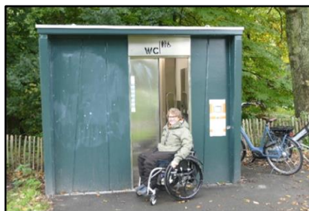
Toiletruimte met aanduiding op de voorzijde van het gebouwtje