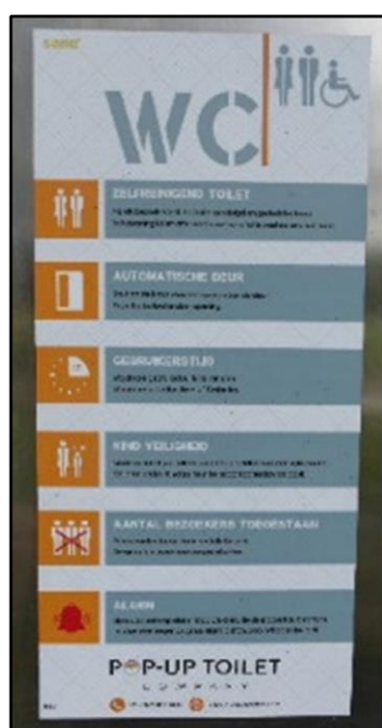
Sticker met toelichtende tekst