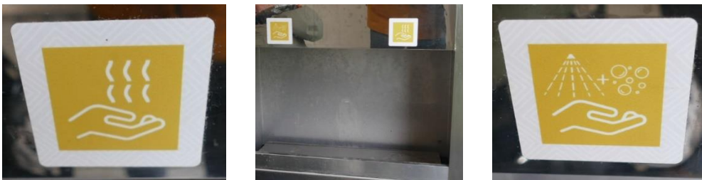
Volautomatische wastafel met warme lucht en water/zeep

19. Wastafelkraan. Niet aanwezig. Er is een automatisch spoel- en droogstelsel.