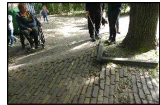
De bestrating tussen toegangshek en milieustraat