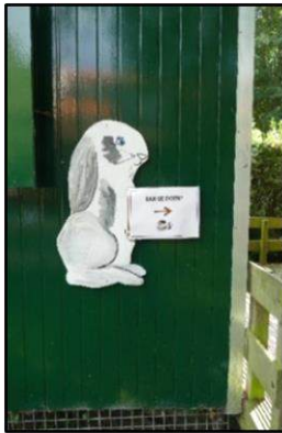
Het konijntje brengt z'n boodschap