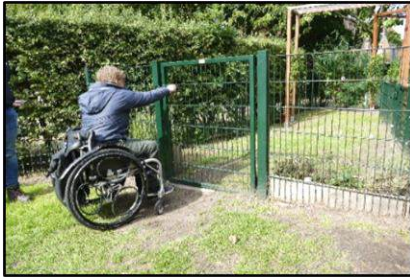
Hek met toegang tot het konijnenverblijf

Op het buitenterrein bevinden zich echter diverse hekken in verband met de dieren. Zoals hierboven al opgemerkt kunnen zij gemakkelijk genoeg worden geopend en gesloten, en zien wij geen reden tot het geven van adviezen. Eén uitzondering daargelaten dus.