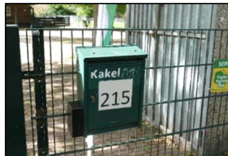
Het in de tekst genoemde brievenbusje