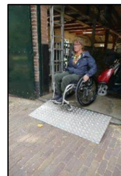
Diverse opnamen van de hier besproken metalen oprit bij de voordeur

Toch had een van de TestTeamleden nog een advies betreffende het op z'n plek blijven liggen van de metalen plaat.