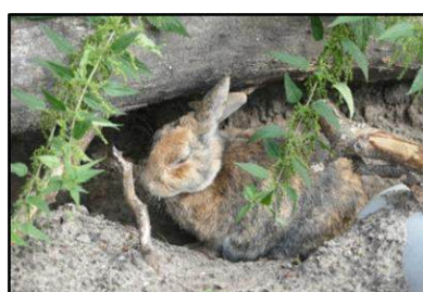
De dierenwereld: Jonge koe, schapen en een konijn