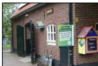
Aanwijzingen op de hoek .... en bij het hek