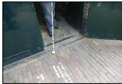
Beide foto's: de drempel bij de achteringang