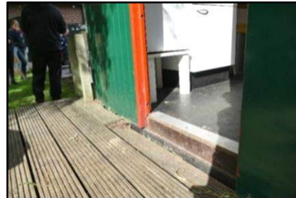
Drempel bij het konijnenverblijf en bij de 'Pipowagen'

Bij de toegang tot het konijnenverblijf bevindt zich een nutteloze betonnen drempel, die een barrière vormt voor rolstoelen. Het kan zijn dat deze rand dient om konijnen tegen te houden, daarom een tweeledig advies.