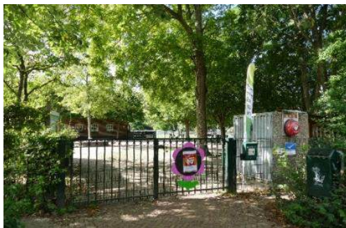
Toegangshek in de Puccinistraat