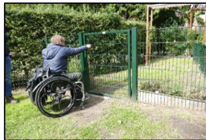
Een van de verblijfshekken