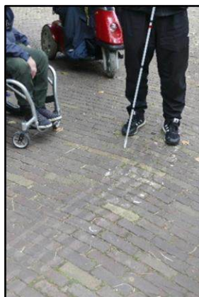
Restanten van geleidelijnen