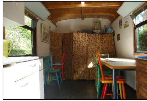
Ruimten in de hoeve en in de Pipowagen