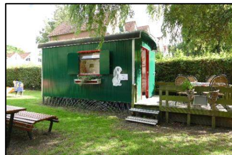
Het toegangstrapje tot de Pipowagen